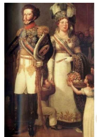
D. Pedro I e a esposa Maria Leopoldina.

Na correspondência da Imperatriz Leopoldina a Dom Pedro I, ela estava pedindo a ele que proclamasse a independência do Brasil. O nobre foi imperador do país durante o Primeiro Reinado (1822 – 31).