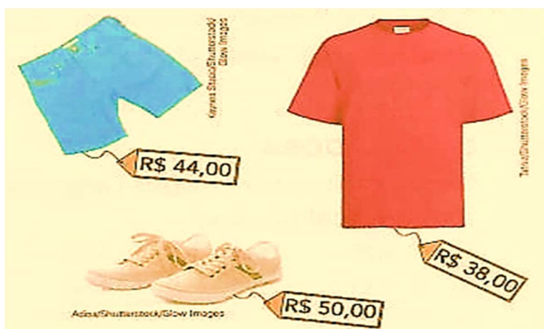
BERMUDA, CAMISETA E TÊNIS

Para responder a lição de terça, quarta e quinta, observe abaixo algumas peças e o preço de cada uma: