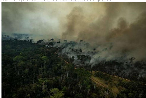
Imagem 2: Queimadas na Amazônia (setembro de 2024)

Você percebeu que nos últimos dias o céu de Curitiba está cinza? Isso que estamos vendo é fumaça das queimadas ilegais que estão acontecendo na Amazônia, Pantanal e Cerrado e tem tomado o céu da maior parte do território do nosso país. A fumaça somada com a baixa umidade atmosférica, são muito prejudiciais para nossa saúde e para o meio ambiente como um todo. Vamos entender melhor sobre esse tema que tomou conta do nosso país?