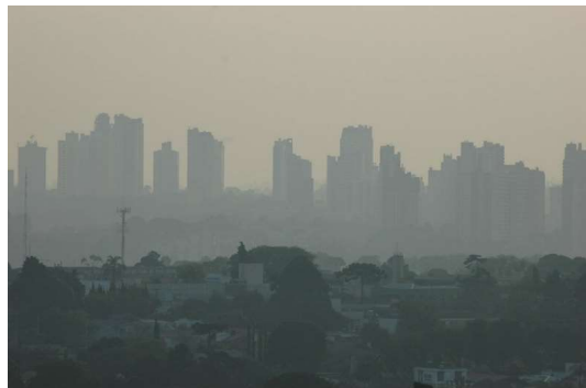
Imagem 1: Fumaça em Curitiba (09 de setembro de 2024)

Você percebeu que nos últimos dias o céu de Curitiba está cinza? Isso que estamos vendo é fumaça das queimadas ilegais que estão acontecendo na Amazônia, Pantanal e Cerrado e tem tomado o céu da maior parte do território do nosso país. A fumaça somada com a baixa umidade atmosférica, são muito prejudiciais para nossa saúde e para o meio ambiente como um todo. Vamos entender melhor sobre esse tema que tomou conta do nosso país?