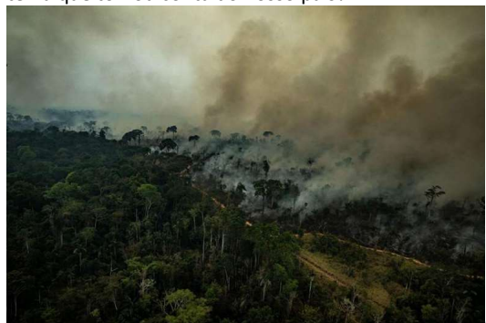
Imagem 2: Queimadas na Amazônia (setembro de 2024)

Você percebeu que nos últimos dias o céu de Curitiba está cinza? Isso que estamos vendo é fumaça das queimadas ilegais que estão acontecendo na Amazônia, Pantanal e Cerrado e tem tomado o céu da maior parte do território do nosso país. A fumaça somada com a baixa umidade atmosférica, são muito prejudiciais para nossa saúde e para o meio ambiente como um todo. Vamos entender melhor sobre esse tema que tomou conta do nosso país?