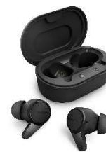
Fone de ouvido sem fio

Saiba mais em: https://www.fatosdesconhecidos.com.br/10-coisas-do-dia-a-dia-que-sao-invencoes-da-nasa/