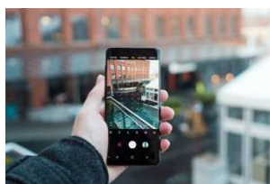
Câmera em celulares