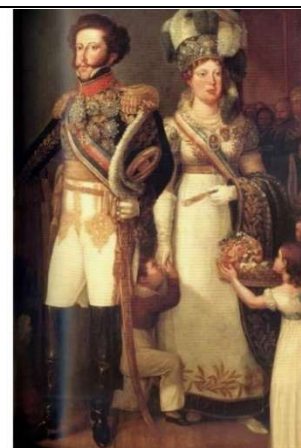
D. Pedro I e a esposa Maria Leopoldina.