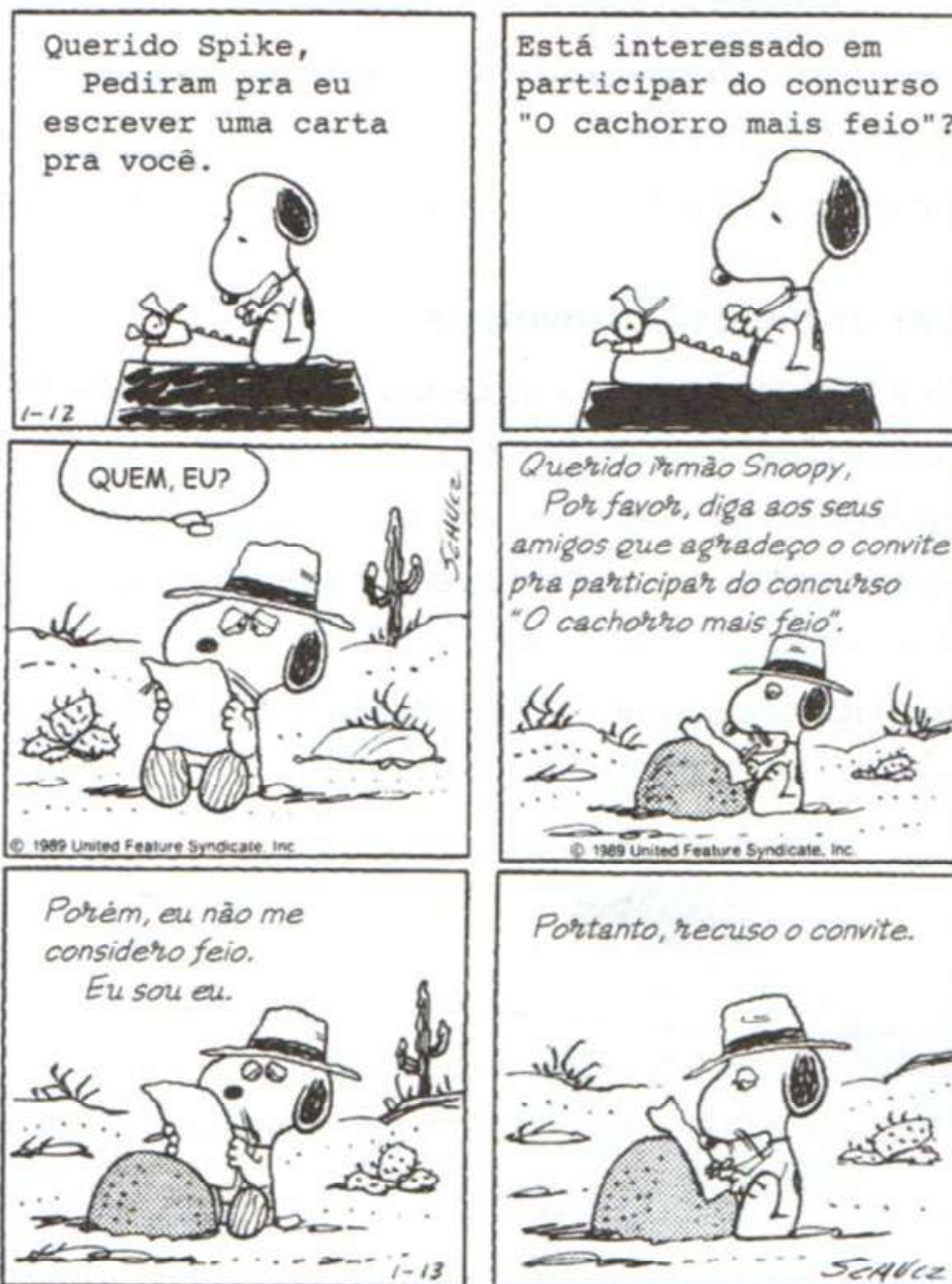
Charles M. Schulz. Ser cachorro é um trabalho em tempo integral. São Paulo: Conrad Editora do Brasil, 2004. p. 98.