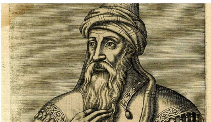
Ilustração de Saladino

O papa Urbano II incentivou os cristãos europeus a participarem das Cruzadas e a seguirem até Jerusalém, cidade considerada sagrada pelos cristãos. Já Saladino foi um líder muçulmano que organizou a defesa dos territórios controlados pelos muçulmanos, incluindo Jerusalém.