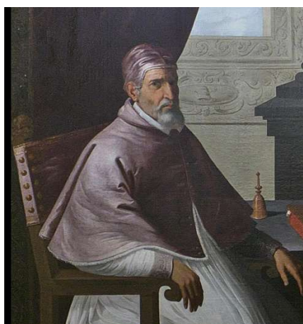
Papa Urbano II

Durante a época das Cruzadas, duas figuras importantes foram o papa Urbano II e o sultão Saladino.