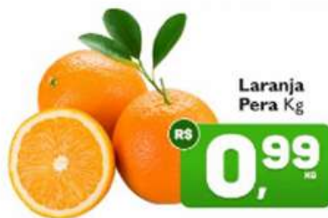
Laranja Pera Kg