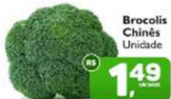
Brocolis Chinês Unidade