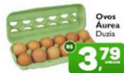
Ovos Áurea Duzia