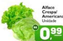
Alface Crespa/ Americana Unidade