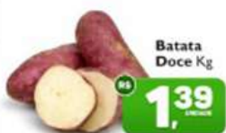
Batata Doce Kg