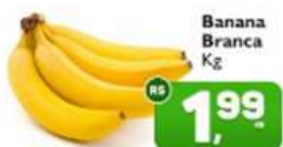
Banana Branca Kg