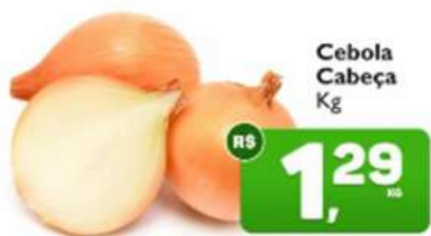
Cebola Cabeça Kg