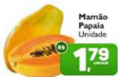
Mamão Papaia Unidade