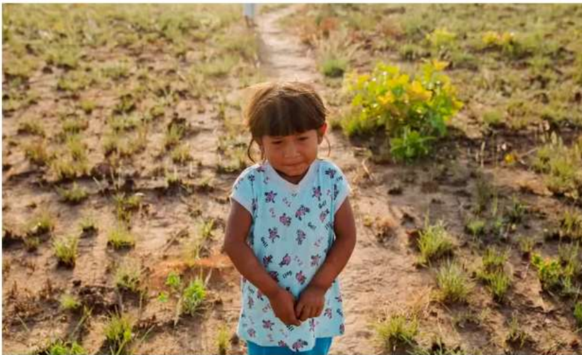
Crianças brincam nos arredores da Aldeia Darcy Bethania, no coração do Mato Grosso.

Por MARIA Clara Vieira - atualizada em 05/01/2016 11h56