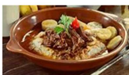
Barreado R$ 42,00 por pessoa