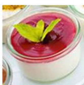
Sobremesa R$ 15,00 por pessoa