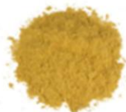
Gengibre em pó R$ 2,00 (50g)