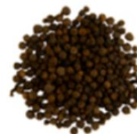
Pimenta em grão R$3,00 (50g)