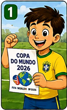
1 Tudo começou com um grande sonho...