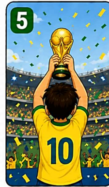
5 O Brasil brilhou na Copa do Mundo 2026!