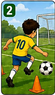
2 Com treino, dedicação e muito esforço...