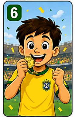
6 Um sonho realizado para sempre na história!