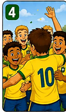
4 A conquista chegou!