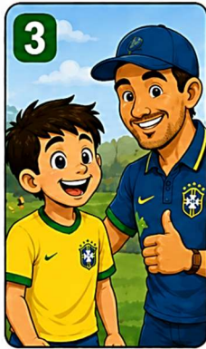
3 Com o apoio do seu técnico e da equipe...